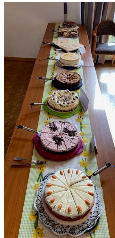
Es gab reichlich Torten und Kuchen.

Es war eine schöne gemütliche Osterfeier, die viel Freude bereitete. Der Vorstand wünscht Allen ein frohes Osterfest! Bleibt gesund und passt gut auf Euch auf. Wir treffen uns jeden 3. Sonntag in Bamenohl im Pfarrheim. Jeder ist herzlich willkommen.