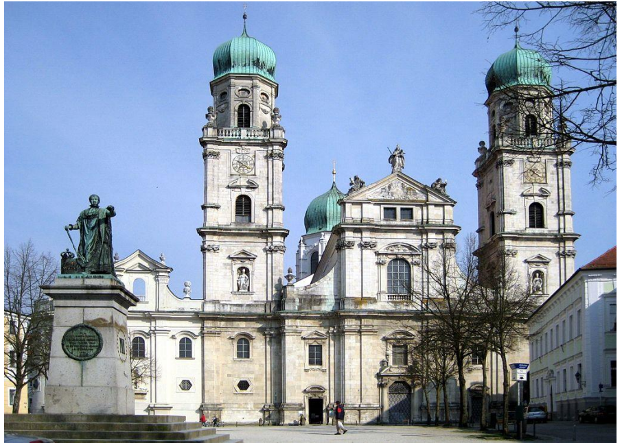
Stefansdom in Passau

Derzeit gehören über 480.000 Katholiken zum Bistum Passau. Das Bistum Passau hat mit etwa 79 Prozent den höchsten Katholikenanteil aller deutschen Bistümer. Die Diözese umfasst 285 Pfarreien und 20 Exposituren, die mittlerweile zu 86 Pfarrverbänden zusammengeschlossen sind, welche von rund 343 Priestern (davon 120 im Ruhestand), 38 ständigen Diakonen sowie von Gemeinde- und Pastoralreferenten seelsorglich betreut werden. Über 50 % der 285 Pfarreien gehören weniger als 1.000 Katholiken an.