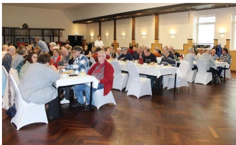
Voller Saal in Cloppenburg