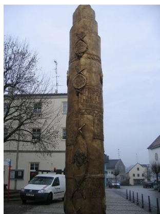
Benediktssäule in Markt