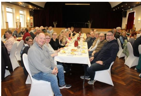
Kamerascheu sind die Cloppenburger jedenfalls nicht.