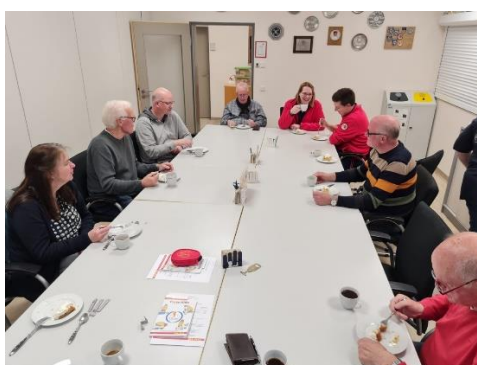
Mit Kaffee und Kuchen geht es noch einmal so gut.