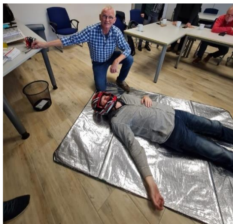
Ein bewusstloser Motorradfahrer – was tun?