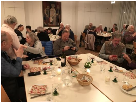
Agapemahl im Saal in München