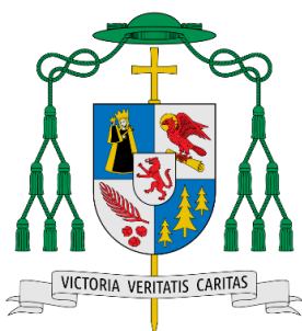
Bischofswappen