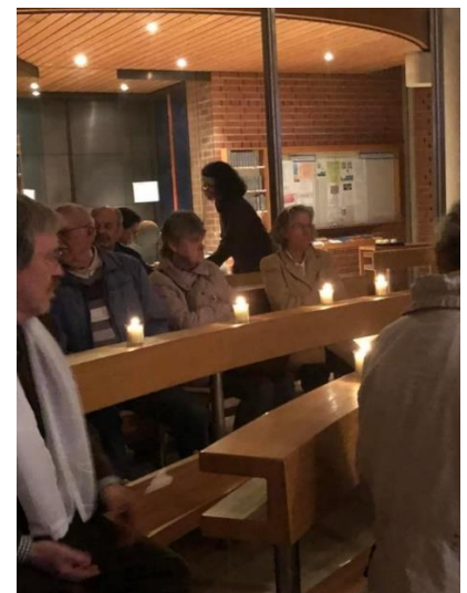
Die Kerzen der Gläubigen erhellten die Kirche.