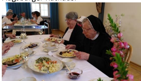
Sr. Salesiana beim Festessen mit ihrer leiblichen Schwester

Sr. Salesiana benutzt Smartphone und Tablet und ist immer interessiert, was es Neues gibt. Wegen körperlicher Beschwerden verlässt sie aber kaum noch das Mutterhaus hinter dem Augsburger Rathaus.