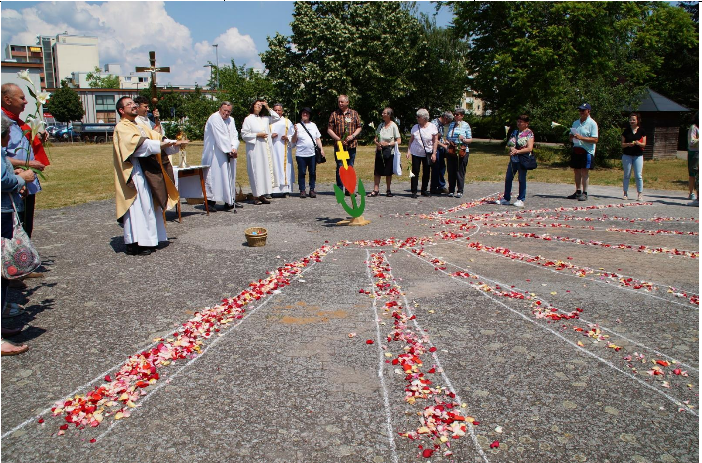
Fronleichnamsfest der Gehörlosen in Mainz 2023