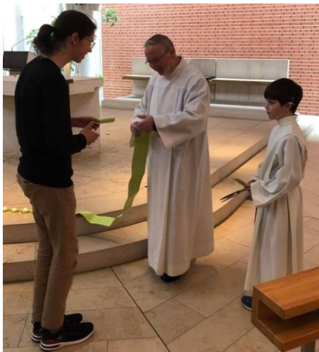
Jede(r) bekam ein Stück vom Band.

Zur Kreuzverehrung erhielt jeder Gottesdienstbesucher ein Schnipsel des Weg-Bandes. Es war ein Zeichen dafür, dass wir Anteil haben am Kreuzweg. Manchmal ist wir diejenigen, die etwas erleiden müssen, manchmal aber auch die, die sich über andere erheben und Leid verursachen, manchmal sind wir die Helfenden an der Seite der Leidenden.