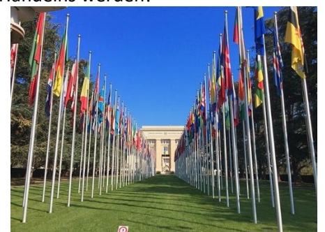
Allee der Nationen bei der UN in Genf

„Leider müssen wir als Lebenshilfe feststellen: Deutschland hat seine Hausaufgaben nicht gemacht und ist noch meilenweit von einer inklusiven Gesellschaft entfernt. An vielen Stellen können Menschen mit Behinderung auch nach 15 Jahren UN-Behindertenrechtskonvention nur eingeschränkt oder gar nicht teilhaben. Zu diesem traurigen Ergebnis kam im vergangenen Jahr die Staatenprüfung der Vereinten Nationen in Genf, und ganz aktuell kritisiert auch der Europarat in seinem Staatenbericht ausgrenzende Strukturen in unserem Land. In den Köpfen der Politiker ist immer noch nicht angekommen, dass die UN-Behindertenrechtskonvention eine Menschenrechtskonvention ist und den Staat unmittelbar bindet. Das ist kein Kann, sondern ein Muss – der Gesetzgeber ist verpflichtet, Inklusion bei jedem Gesetz mitzudenken. Die Lebenshilfe fordert deshalb nachdrücklich: Deutschland muss viel mehr für die Inklusion tun. Und dafür müssen Bund, Länder und Kommunen an einem Strang ziehen. Inklusion muss endlich Grundlage allen politischen Handelns werden!“