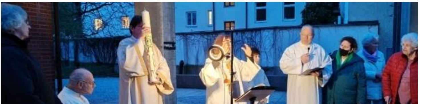
Ostern in München