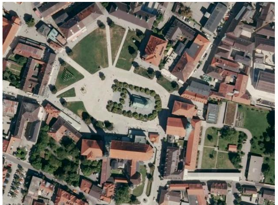
Wallfahrtsort Altötting von oben