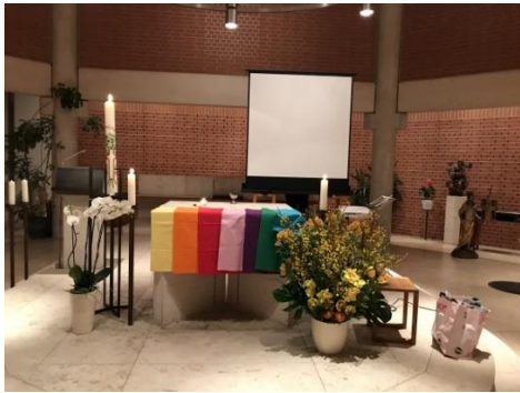
Altar in der Osternacht – die Tücher sind Symbole für die sieben Lesungen.