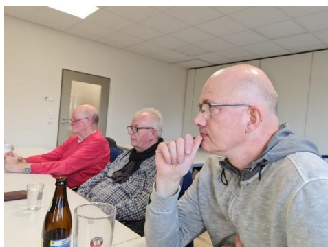
Aufmerksam und gespannt