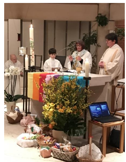
Lobpreisgebet zur Kommunion