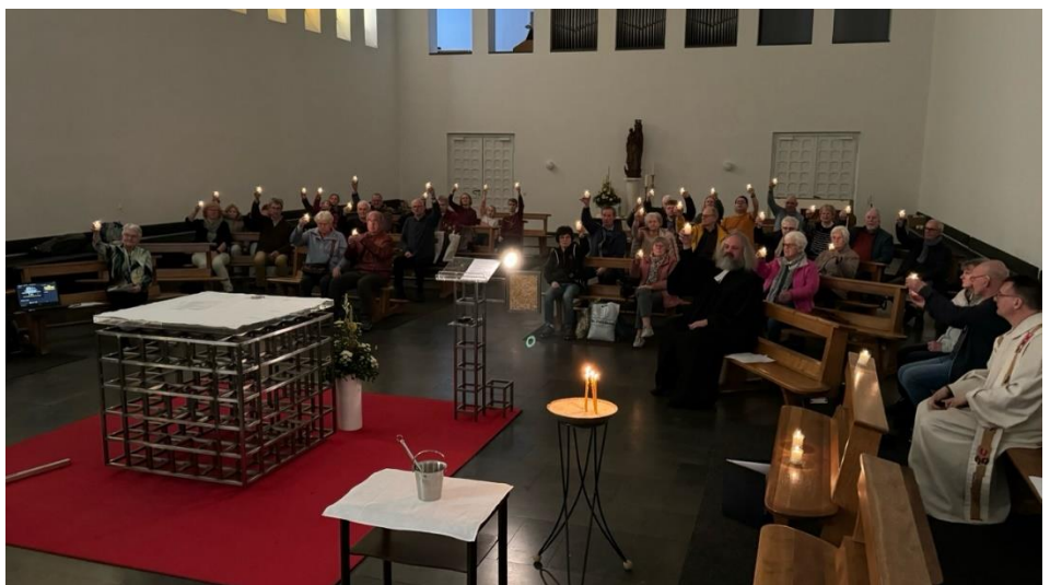
Viele Kerzen erleuchteten die Kapelle