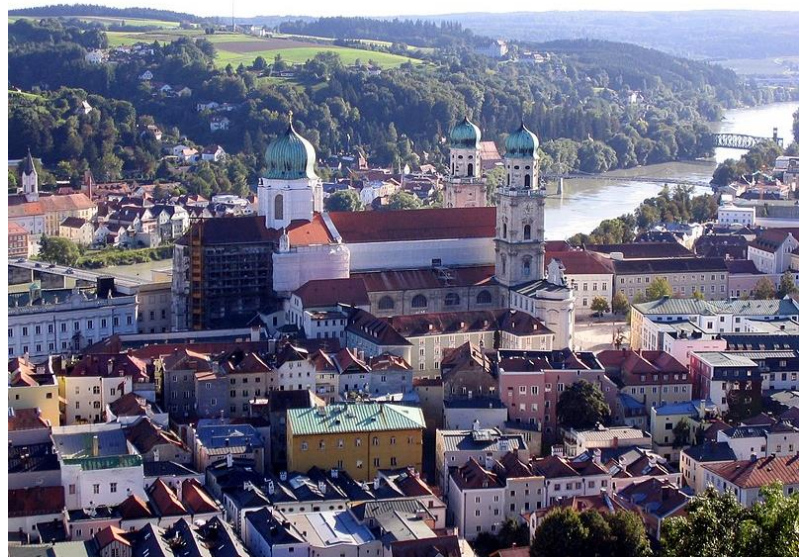
Altstadt von Passau mit Dom

Vom 14. bis 17. Jahrhundert erlebten Bistum und Hochstift Passau viele Höhen und Tiefen. In der Zeit des Trienter Konzils wirkte Fürstbischof Urban von Trennbach (1561–1598)