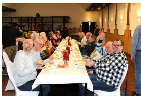
Und auch hier nur gute Stimmung.