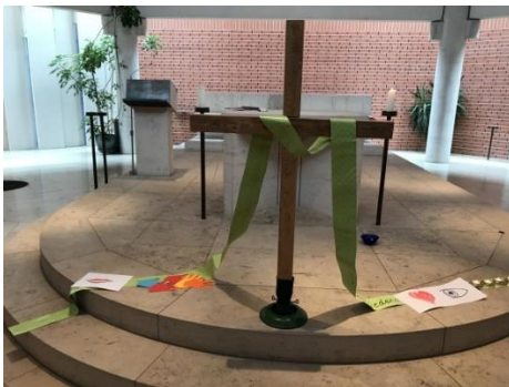
Kreuz mit Weg-Band

Schon um 11.00 Uhr feierten wir am Karfreitag das Gedenken an Sterben Jesu Christi. Ein grünes Band stellte den Kreuzweg dar. zu den Menschen, die Jesus auf seinem Leidensweg begegneten wurden daraufgelegt.