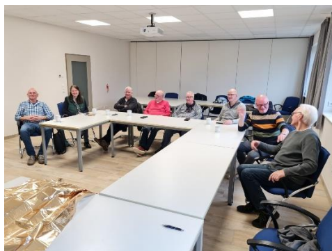
Die Leute vom Darts-Club lassen sich alles erklären.