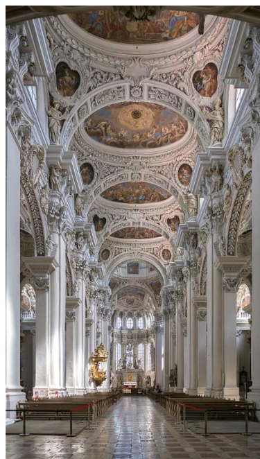
Innenraum des Doms

Das Bistum wurde 739 von Bonifatius gegründet. Während des Mittelalters entwickelte es sich mit 42.000 km 2 zum größten Bistum des Heiligen Römischen Reichs und dehnte sich über Wien bis in den Westen Ungarns aus. Das Hochstift Passau war mit zuletzt 991 km 2 wesentlich kleiner und lag rund um die Stadt Passau überwiegend in der Region des Bayerischen Waldes. Die Geschichte des Christentums im Gebiet des Bistums beginnt jedoch schon lange vor 739.