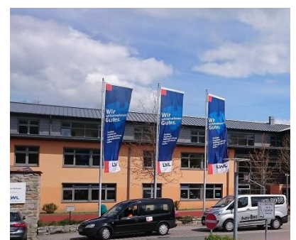
Die heutige Moritz-von-Büren-Schule

„Wenn Du an ererbter Taubheit leidest, bekommst Du wohl eine Vorladung vor das Erbgesundheitsgericht. Da geht es um die Frage, ob Du auch niemals Kinder haben sollst. – Vor allem ein: Nichtwahr, Du wirst die Wahrheit sagen, wenn Du gefragt wirst. Denn so will es Gott von Dir. (...) Vielleicht bestimmt das Erbgesundheitsgericht: Du sollst durch eine Operation unfruchtbar gemacht werden. Du wirst traurig, Du denkst: ‚Das möchte ich nicht. Ich möchte heiraten und Kinder haben. Denn ich habe Kinder lieb.‘ Aber nun überlege einmal: Möchtest Du schuld daran sein, dass die Taubheit noch weitervererbt wird? (...) Nein, das möchtest Du doch wohl nicht. Die Verantwortung ist zu groß.“