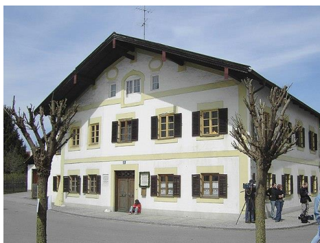
Der verstorbene Papst Benedikt XVI. (Josef Ratzinger) wurde in diesem Haus in Markt bei Altötting geboren.